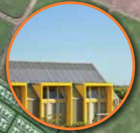
Greencoast International School