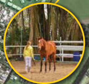
Les Ecuries de Mon Rocher & Future Sport Centre