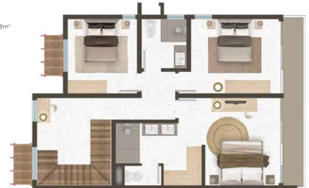
Ground Floor Rez-de-chaussée

Chambre principale incluant salle de bains : 25.8m 2 Chambre 2 : 14.2m 2 Chambre 3 : 10.8m 2 Chambre 4/Study : 9.8m 2 Salle de bains 2 : 4.6m 2 Toilette Invité : 2.1 m 2 Salon/Salle à manger/Cuisine : 30.0m 2 Buanderie : 5.2m 2 Véranda couverte : 28.2m 2 Superficie habitable : 163m 2