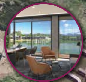
The Strand Lakeside Office