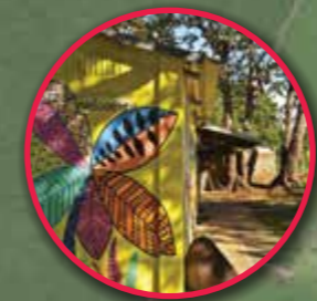
Creative Park & L'Aventure du Sucre Museum