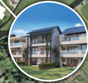
Mango Village: Apartment, Duplex & Penthouse