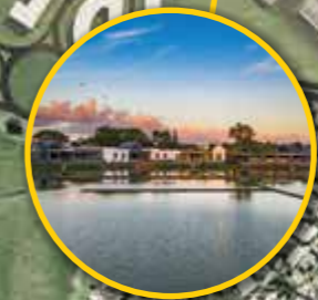
Mahogany Shopping Promenade