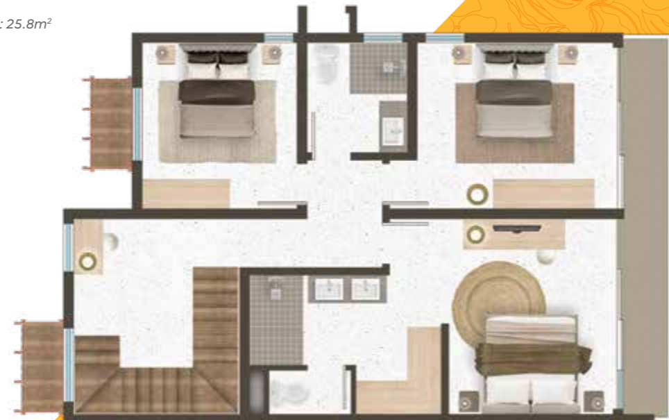
Ground Floor Rez-de-chaussée

Chambre principale incluant salle de bains : 25.8m 2 Chambre 2 : 14.2m 2 Chambre 3 : 10.9m 2 Salle de bains 2 : 4.6m 2 Toilette Invité : 2.1 m 2 Salon/Salle à manger/Cuisine : 30.1m 2 Buanderie : 5.2m 2 Véranda couverte : 28.2m 2 Superficie habitable : 152m 2