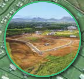
Les Muguets Residential Plots