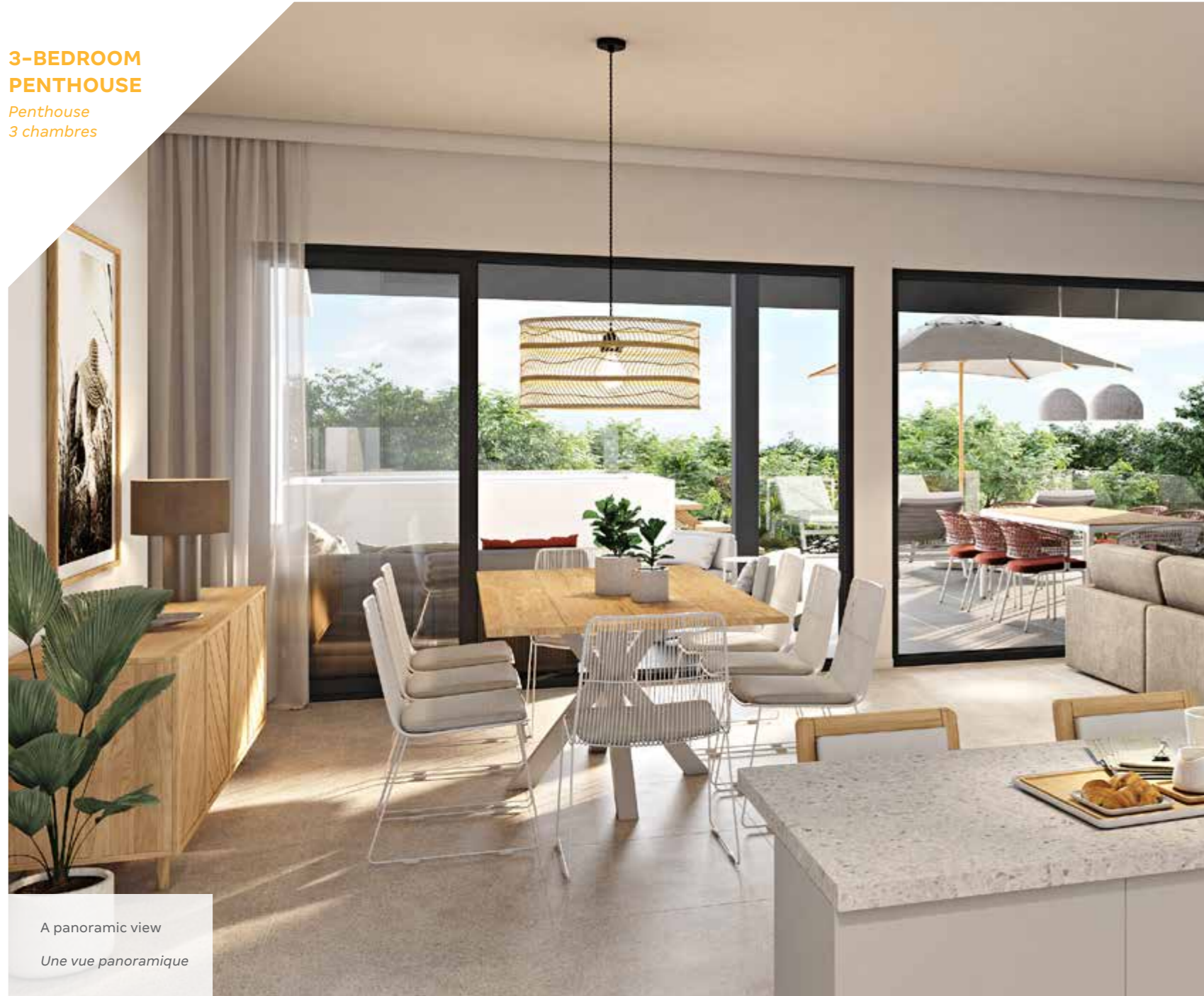
A panoramic view Une vue panoramique