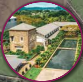
Beau Plan Business Park