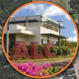
African Leadership Campus